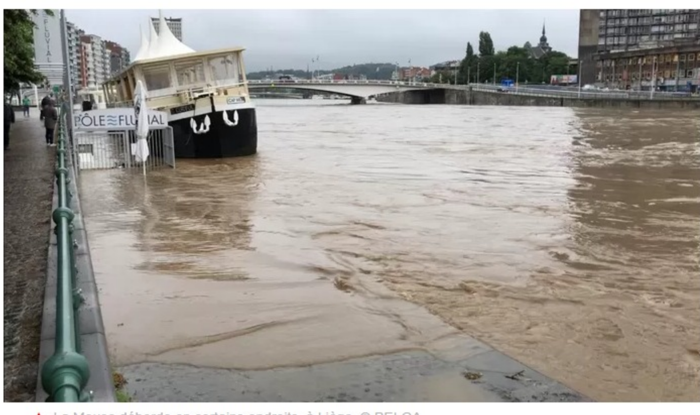
▲ La Meuse déborde en certains endroits, à Liège.