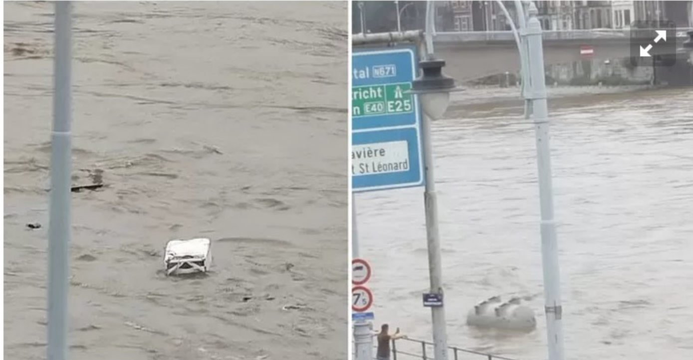
▲ Frigos, cuves, branches, sacs-poubelles, la Meuse emporte tout sur son passage.

Il avait déjà été conseillé aux habitants d'Angleur, à proximité de l'Ourthe, de quitter leur domicile si c'est encore possible et de se réfugier dans leur cercle familial et amical. Les services sociaux de la Ville les accueillent également au hall omnisports de Grivegnée , rue Nicolas Spiroux. S'il n'est plus possible d'évacuer, le conseil est de monter aux étages.