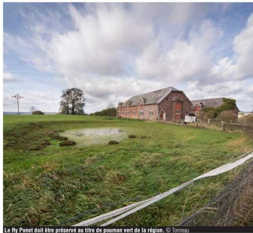
Le Ry Ponet doit être préservé au titre de poumon vert de la région.

« Notre souhait, c'est de sanctuariser la totalité du site, inter-