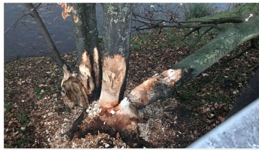
Précis et méthodique le castor peut castrer ses arbres à terre en très peu de temps

Réintroduit en Belgique il y a une vingtaine d'années, le castor est protégé par une directive européenne de 1992. Il est interdit de le chasser, le tuer, le capturer, le détenir, le transporter et même le perturber. Une protection qui a permis aux familles de castors de se multiplier. S'il est habituel de les voir du côté de l'île aux Corsaires au confluent de l'Ourthe, le canal de l'Ourthe et la Vesdre ou le long du Ravel près du centre commercial Belle-île, c'est assez surprenant de découvrir leur œuvre près du centre-ville.